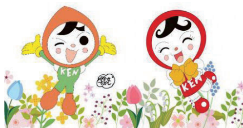
人権イメージキャラクター 人KENまもる君・人KENあゆみちゃん